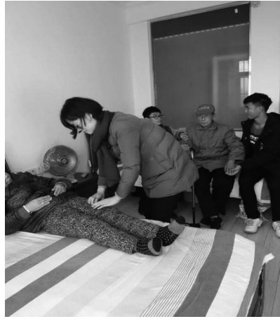
图4 湖北职院护理学院学生社会实践