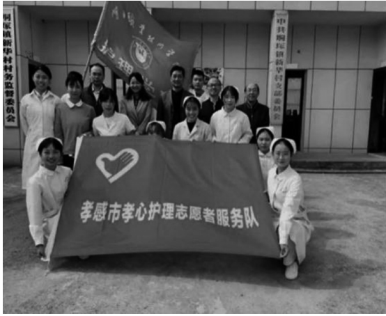
图3 孝感市孝心护理志愿者服务队社会活动